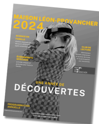
Programmation annuelle des activités 2024

Notre objectif est de susciter l'émerveillement chez les familles et le grand public. En 2024, nous visons à formaliser une offre de services pour des animations externes, au-delà de nos propres événements, dans le but de devenir un acteur incontournable de la promotion des sciences naturelles.